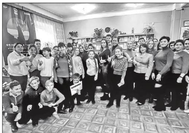
■ Перед вами — ребята, обнаружившие в себе талант гида